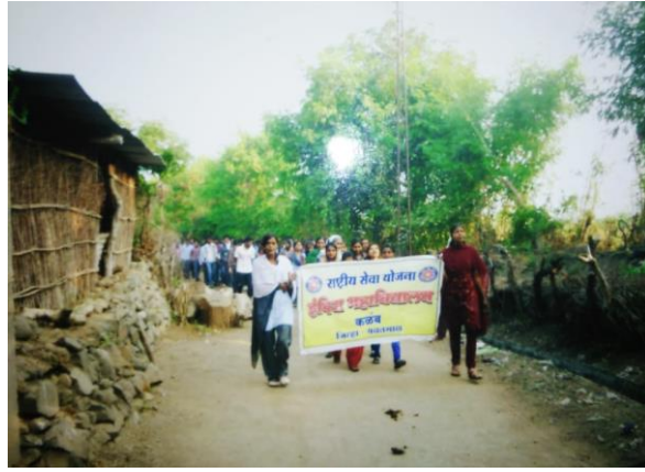
Participants Took an Oath to Protect Constitutional Values and Subsequently Participated in a Rally